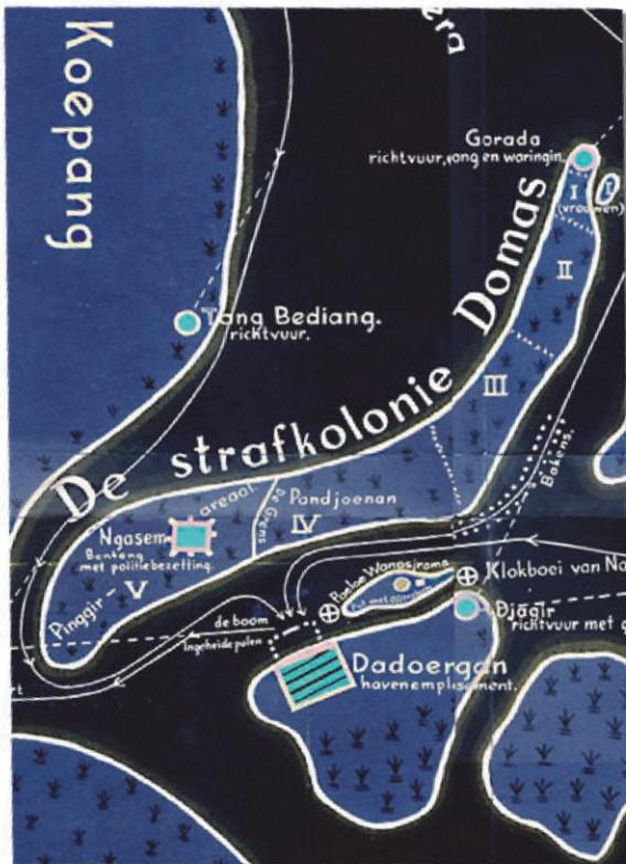
Gambar 2: Penjara Hindu Jawa (Abdillah, 2005, hlm. 30)

Keras dengan volume suara karena tuntutan alam menggerakkan karakter budaya Jawa Arek dalam satu sisi pengucapannya yang melahirkan sikap dan tindakan. Pada sisi lain, Keras pada manusia Jawa Arek adalah tantangan alam disekitarnya, seperti letusan Gunung Kelud. Wiwik Hidayat menuturkan bahwa “Perbedaan mendasar sesungguhnya terjadi sepanjang tahun 1037-1468 atau selama 431 tahun, terutama setelah tercatatnya aktivitas gunung Kelud yang mengalirkan lahar dinginnya melalui sungai Brantas, “... dalam waktu mana diperkirakan telah terjadi le usan gunung Kelud 431:20=22 kali, berturut-turut telah tertutup Bengawan antara Jagir dan Waru, lalu Bengawan antara Taman dan Waru, dan Bengawan Terung antara Jeruk Legi dan Taman”.