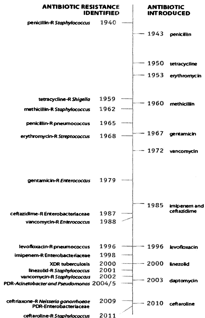
Gambar 2. Alur Waktu Kejadian Resistensi Mikroba Terhadap Antimikroba ( http://www.cdc.gov/pdf/5-2013-508 ).