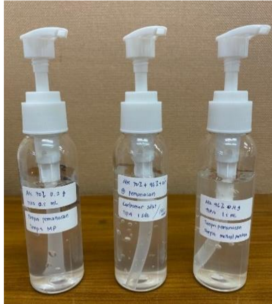
Gambar 3. Produk hand sanitizer