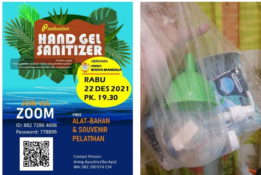
Gambar 1. Poster kegiatan dan paketan bahan dan alat untuk mitra

Walaupun pelatihan dilaksanakan secara online, namun hal ini tidak