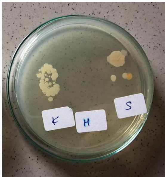
Gambar 5. Uji