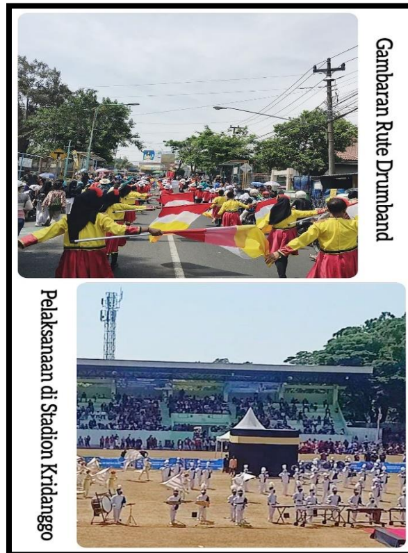
Gambar 4. Kegiatan Perlombaan