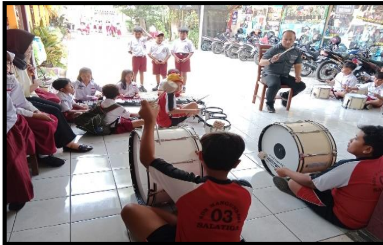
Gambar 1. Latihan Drumband

tidak terjadi kesalahpahaman. Penulis juga merekomendasikan agar kegiatan ini tidak hanya sebatas dalam bentuk pendampingan saja, tetapi juga dapat dalam bentuk pelatihan dan lain sebagainya.