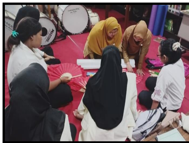
Gambar 2. Pembuatan Atribut

Para peserta lomba memiliki antusias yang tinggi, hal ini dapat dilihat dari ketekunan dan semangatnya dalam mengikuti latihan, sehingga saat pelaksanaan perlombaan mereka dapat menampilkan hasil terbaik. Sebelum perlombaan dimulai, para peserta lomba